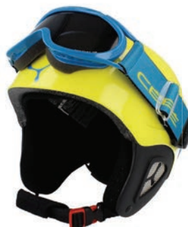
ÉQUIPEMENT DE SPORT