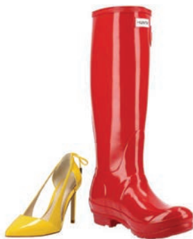
CHAUSSURES ET BOTTES